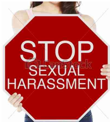
From Google clipart